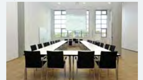
NINO op de 1e verdieping Grootte van de ruimte: 96 m2, stoelen in rijvorm: 80 personen, theateropstelling: 32 personen, carré-vorm: 28 personen, blokopstelling: 24 personen