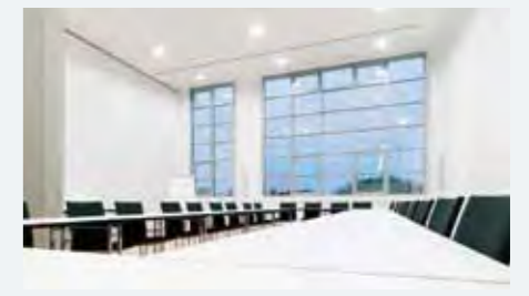
Rawe op de 1e verdieping Grootte van de ruimte: 91 m2, stoelen in rijvorm: 80 personen, theateropstelling: 32 personen, carré-vorm: 28 personen, blokopstelling: 24 personen