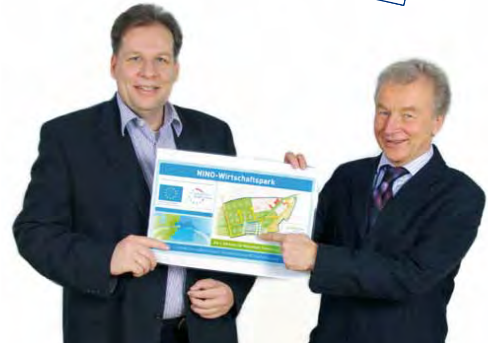
NINO Sanierungs- und Entwicklungsgesellschaft mbH

Het eerste adres voor economie, technologie en ontwikkeling