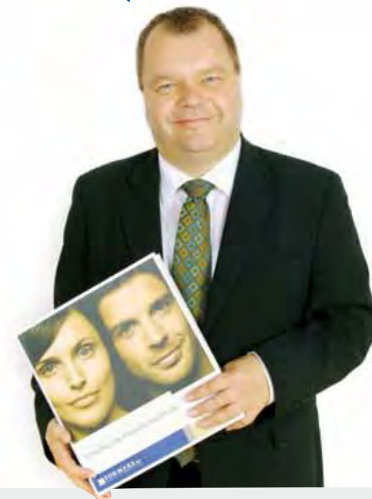
Frank Knöpker GmbH & Co. KG