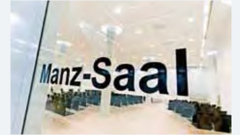
Manz-Saal op het begane grondoppervlak Grootte van de ruimte: 323 m2, stoelen in rijvorm: 370 personen, theateropstelling: 180 personen, vierkante opstelling: 150 personen